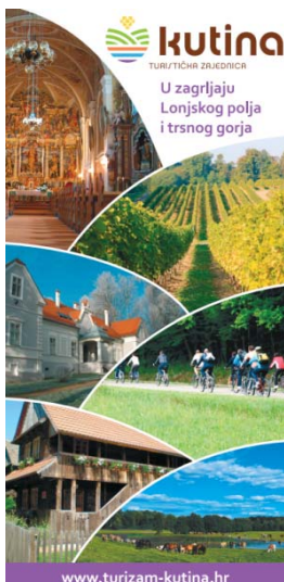
Novi banner TZG Kutine

Nabavljeno je 500 komada promotivnih vrećica, banner i lavanda vrećice.