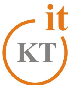
Slika 3. Logo Programa Kutina IT 2010